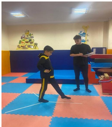
شکل ۱. اندازه‌گیری تعادل پویا

برمی‌گشت. فاصله محل تماس تا مرکز، فاصله دستیابی بود. هر آزمودنی هر کدام از جهات را سه بار به‌صورت دایره‌ای انجام می‌داد و در نهایت میانگین آن‌ها محاسبه شد.