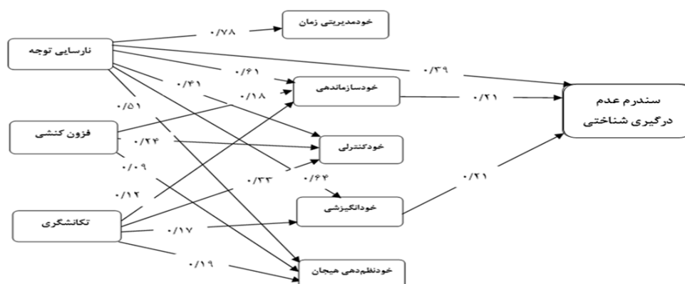
شکل ۳. مدل برازش یافته

خودانگیزی نقش میانجی ایفا کرده‌اند ولی اثر غیرمستقیم فزون کنشی بر سندرم عدم درگیری شناختی، فقط خودسازماندهی/حل مسئله نقش میانجی داشته است. به طور کلی می‌توان گفت مؤلفه‌های نارسا کنش‌وری اجرایی نقش میانجی معناداری را برای نشانه‌های اختلال نارسایی توجه/فزون کنشی و سندرم عدم درگیری شناختی ایفا می‌کند.