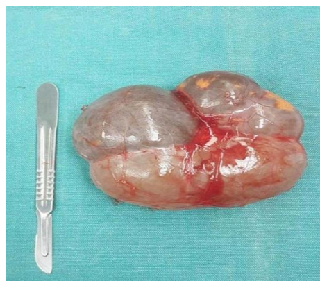
شکل ۲. نمای ماکروسکوپی کیست ساده آدرنال پس از جراحی

Drager و آماده‌سازی‌های جراحی، شکم در معرض قرار گرفت. در طول جراحی، یک توده بزرگ در پشت دم پانکراس تشخیص داده شد (شکل ۲). توده، کیستیک بوده و بعد از آماده شدن جهت بررسی‌های بیشتر به بخش پاتولوژی فرستاده شد. مطالعات پاتولوژیک بر روی نمونه نشان داد که توده یک کیست اپی‌تلیال ساده آدرنال است (شکل ۳).