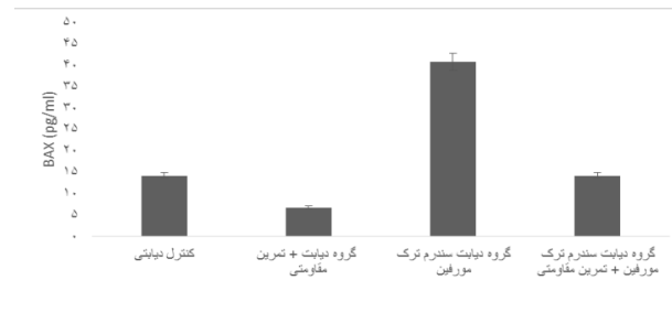
نمودار ۱. غلظت BAX در بافت قلبی در گروه‌های آزمایشی * تفاوت معنادار با گروه کنترل در پژوهش ( p<0/05 ). # تفاوت معنی دار نسبت به سایر گروه‌های پژوهش

دارد ( F=278/2 , p<0/01 ) با درجه آزادی ۳ و ۲۸ (نمودار ۲). نتایج آزمون توکی نشان داد که در BCL2 افزایش معنی‌داری بین دیابت+ تمرین مقاومتی و دیابت سندرم ترک مورفین با گروه کنترل دیابتی (به ترتیب p<0/05 , p<0/001 )، بین گروه دیابت سندرم ترک مورفین و دیابت سندرم ترک مورفین+ مقاومتی با گروه دیابت+ تمرین مقاومتی (به ترتیب p<0/001 )، و بین گروه دیابت سندرم ترک مورفین+ تمرین مقاومتی با گروه دیابت سندرم ترک مورفین ( p<0/05 ) وجود دارد. در صورتی که در گروه دیابت سندرم ترک مورفین+ تمرین مقاومتی با گروه کنترل دیابتی افزایش معنی‌داری در BCL2 مشاهده نشد ( p>0/05 ).