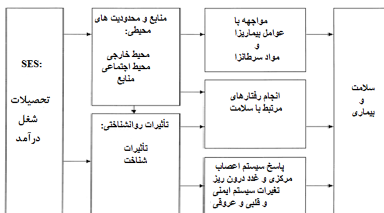
شکل ۲: مدل مسیر تأثیر وضعیت اقتصادی-اجتماعی بر سلامت

می‌شود. برخی از حقایقی که در این مدل بیان می‌شود بدین صورت است: اول اینکه یک ارتباط قوی و دو طرفه بین وضعیت اقتصادی-اجتماعی و سلامت وجود دارد. دوم: شیب وضعیت اقتصادی-اجتماعی می‌تواند در شاخص‌های قبل از شروع بیماری از قبیل: فشار خون، سطح کورتیزول، چاقی مرکزی و آترواسکلروز شرین دیده شود. سوم: ارتباط بین وضعیت اقتصادی-اجتماعی و سلامت در بدو تولد شروع و در طول زندگی ادامه می‌یابد اما قدرت و ماهیت ارتباط می‌تواند